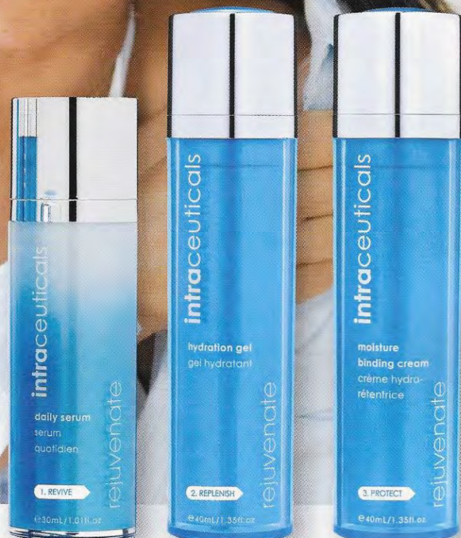
TRIN 1 Daily Serum Kr. 1.100,-

Ring 33 13 05 05 for oplysning om nærmeste forhandler