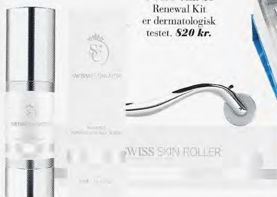
SWISS CLINIC Renewal Kit er dermatologisk testet. 820 kr.

Gelen indeholder beta-glukan fra svampe, der fremmer dannelsen af EGF (Epidermal Growth Factor), altså stimulerer dannelsen af ny, sund hud. Rulleren kommer i tre forskellige længder, alt efter hudtilstand. Og til at booste healingen indefra støtter kosttilskudet Swiss Immunizer kroppens og dermed hudens immunforsvar. SwissClinic anbefaler kurforløb på 7 dages rulning, efterfulgt af 7 dages pause, og absolut ingen sol efter rulning.